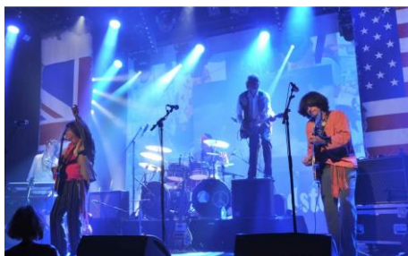
Groupe Destination Woodstock