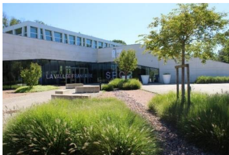
Le Complexe sportif La Vallée Française à Bonnières-sur-Seine

Ce rassemblement sera également le moment pour découvrir toutes les richesses de ce territoire, que ce soient les plus beaux paysages de nos communes ou les producteurs locaux , qui pratiquent le circuit court , et aussi les nombreuses bonnes tables. En effet, en amont de la journée du 27 avril, un concours de photographie sera organisé avec l'exposition de l'ensemble des contributions le jour J et la remise des prix, qui seront sélectionnés parmi les adresses du territoire.