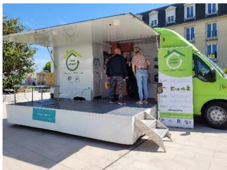
Le Nomad'APPART par Energies Solidaires