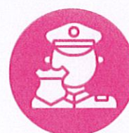
Un officier de prévention