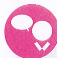
Un travailleur social