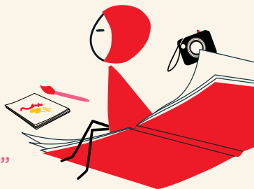
Illustration de : @ninalittlered