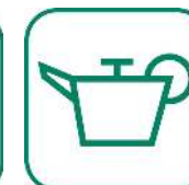
HUILES DE VIDANGE