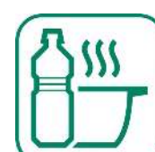
HUILES DE FRITURES