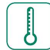
LIQUIDES DE REFRIGÉRISSMENT