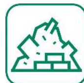
DÉBLAIS / GRAVATS