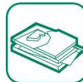
PLÂTRE ET PLAQUES DE PLATRE