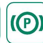
LIQUIDES DE FREINS