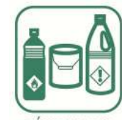
DÉCHETS DIFFUS SPECIFIQUES (DDS)