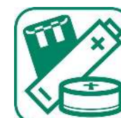
PILES ET ACCUMULATEURS