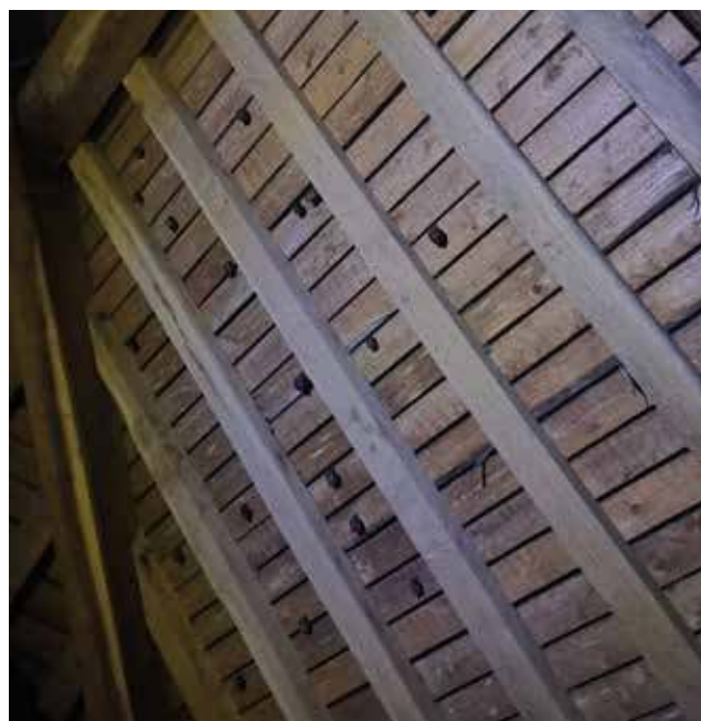
Nurserie de Petits Rhinolophes

Durant près de deux heures, les 25 participants ont pu découvrir le monde fascinant de ces petits mammifères nocturnes, et se familiariser avec les espèces qui fréquentent le territoire. Malgré les conditions météorologiques difficiles, la soirée s'est terminée par une déambulation dans le village à la recherche de ces petites bêtes discrètes mais utiles !