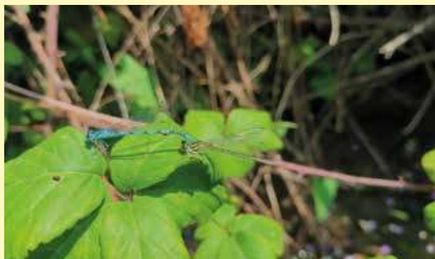
Couple d'Agrions de Mercure

Ces informations permettront à terme d'établir un cahier technique, accessible à toute personne souhaitant réaliser des entretiens de cours d'eau ou fossés dans le respect de la biodiversité.