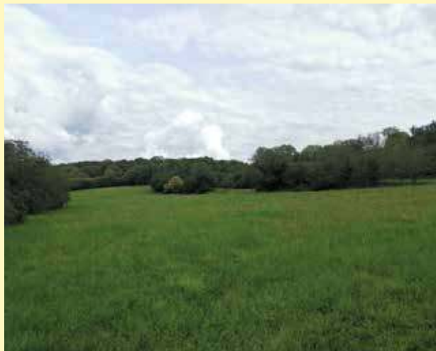
Prairie engagée en Mesure Agro-Environnementale et Climatique

Les campagnes précédentes ont rencontré un grand succès, avec une centaine d'agriculteurs du territoire engagés dans des mesures de réduction de traitements phytosanitaires, de création ou de gestion de prairies, d'entretien de haies, mares, fossés, ou vergers, entre autres. Le nouveau PAEC continue sur cette lancée, avec sur sa première année une soixantaine d'agriculteurs reconduisant des mesures ou s'engageant pour la première fois dans le dispositif.