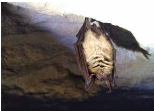
Murin à oreilles échanquées

Louise-Anne a donc établi des cartographies des territoires de chasse potentiels autour de chaque nurserie connue, en évaluant l'intérêt de chaque habitat pour l'espèce concernée. Les résultats de cette étude permettront une meilleure prise en compte des enjeux chiroptères en période estivale dans les sites Natura 2000, et des informations sur les zones à enjeux à protéger dans le cadre de la nouvelle Stratégie de création d'Aires Protégées.