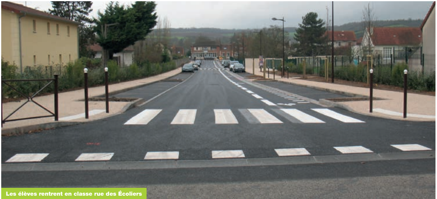
Les élèves rentrent en classe rue des Écoliers

Depuis le 16 novembre 2015, l'ouverture de la rue des Écoliers a permis l'instauration de nouveaux modes de circulation et de desserte. Voici un premier bilan... ainsi qu'une piqûre de rappel!