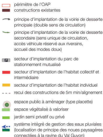
OAP des Balloches: opération du Clos Prieur