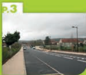
Bienvenue dans la rue des Écoliers