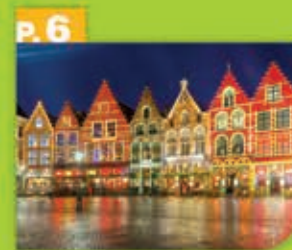
Les Copains d'abord au programme !