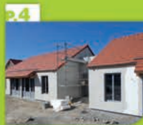
Une maison pour les personnes âgées