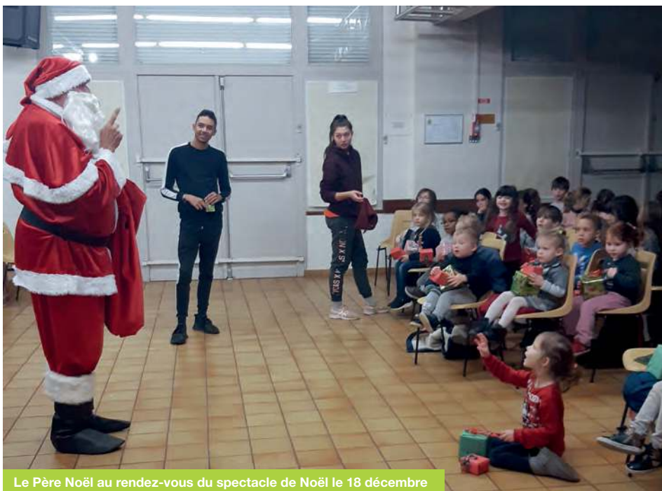
Le Père Noël au rendez-vous du spectacle de Noël le 18 décembre

Informations et inscriptions auprès d'Olivier : 06 63 31 57 84 / 09 63 28 40 38