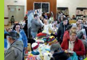
Le marché de Noël