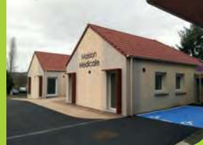
La Maison médicale fin prête !