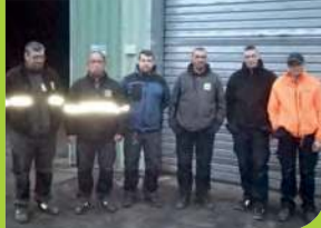
Une équipe, des métiers...