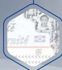
Effet visuel et tactile