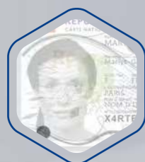
Effet mat et brillant sur le portrait