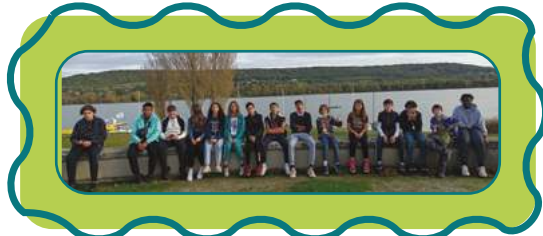
Challenge Ados des vacances de la Toussaint sur l'île aux loisirs de Moisson.