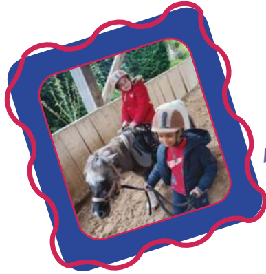
Activité Poney à St Aquillin de Pacy avec les maternelles, les mercredis d'octobre.