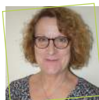
Ghislaine HAUETER Maire